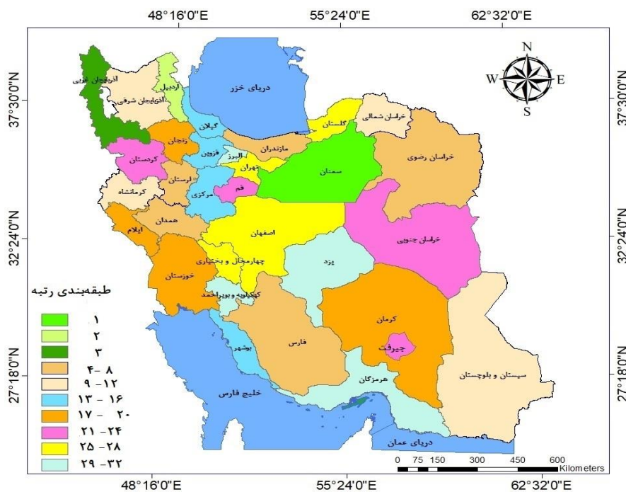
نقشه‌ی ۱ رتبه‌بندی استان‌های کشور بر اساس شاخص‌های مزیت فیزیکی و ضریب نوسان آن‌ها در طی دوره مطالعه ۹۸-