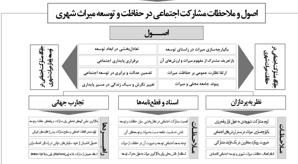
شکل ۱: چارچوب کاربردی مشارکت اجتماعی در حفاظت و توسعه یکپارچه میراث شهری